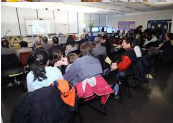
Hình trên: Thánh lễ Tạ Ôn Nghĩa Sinh năm thứ 27 đã được tổ chức tại trường Clemente Community Academy of Chicago vào ngày Thanksgiving 2010 cho mọi người lương giáo