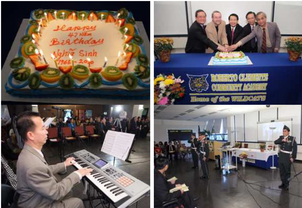
Hình trên: Sau khi đón nhận bánh thánh, quý huynh trưởng Nghĩa Sinh và quý khách cắt bánh Sinh Nhật thứ 47 của Hiệp Hội Nghĩa Sinh (1963-2010) với nhạc bản "Happy Birthday to Nghĩa Sinh."

Trong tinh thần lễ hội, Nghĩa Sinh đã hát mừng sinh nhật và cắt bánh Sinh nhật Nghĩa Sinh năm thứ 47 trong niềm hân hoan hội ngộ và chúc mừng những thành quả hoạt động xã hội và giáo dục của Hiệp Hội Nghĩa Sinh trong 47 năm qua.