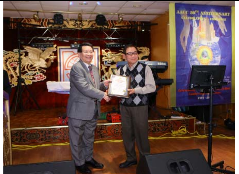
Hình trên: Nghi thức trao Bằng Tri Ân cho quý ân nhân đã giúp cho lễ hội AACC năm thứ 30 do Nghĩa Sinh bảo trợ thành công.