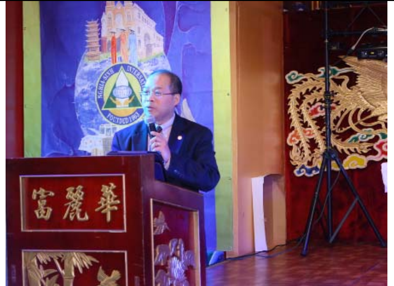
Hình trên: Nghi thức khai mạc Dạ tiệc Tri Ân và chúc mừng Kim khánh thành lập Liên đoàn Nghĩa Sinh tổ chức tại Chicago.