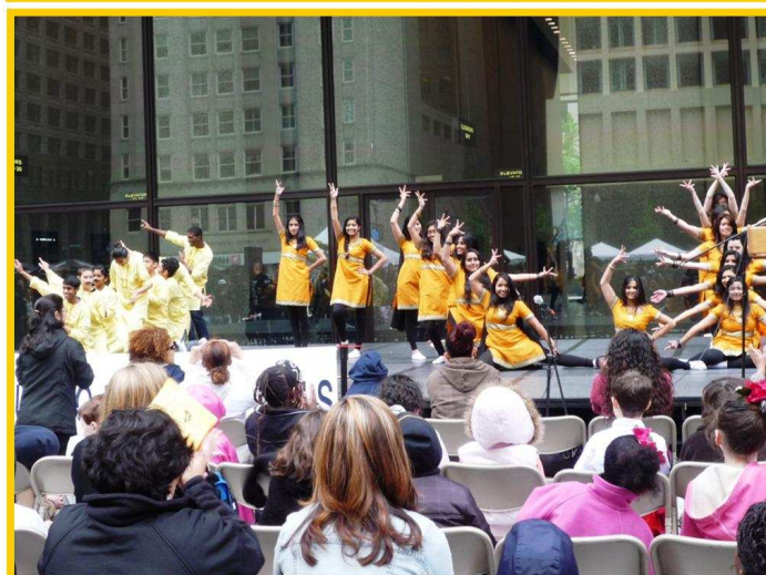
Hình trên: Trên 45 ca đoàn và vũ đoàn đến trình diễn tại Hội Lễ Văn Hóa Á Kiều năm nay để giới thiệu âm nhạc, nghệ thuật, văn hóa Việt Nam và Á Châu đến các cộng đồng người Mỹ tại Chicago và các thành phố phụ cận.