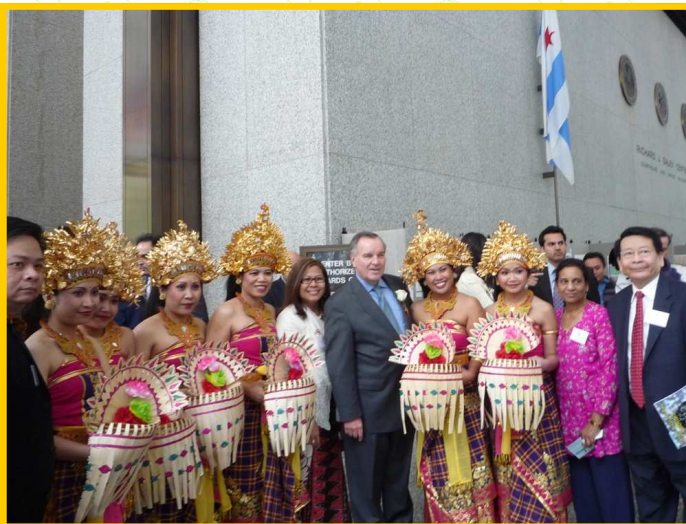
Nghĩa Sinh hợp tác tổ chức Lễ Hội Văn Hóa Á Kiều tại Chicago năm Thứ 12 Từ ngày 17 đến 21 tháng 5 năm 2010 với gần 18 ngàn người tham dự