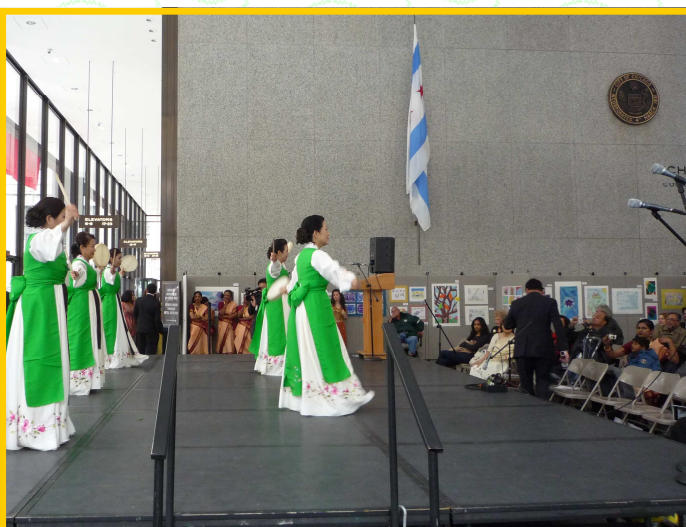
Trên 45 ca đoàn và vũ đoàn đến tham dự để giới thiệu âm nhạc, nghệ thuật, và văn hóa Á châu đến các cộng đồng người Mỹ tại Chicago