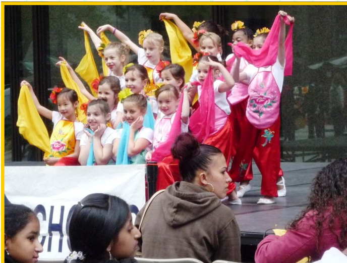
Trên 45 ca đoàn và vũ đoàn đến tham dự để giới thiệu âm nhạc, nghệ thuật, và văn hóa Á châu đến các cộng đồng người Mỹ tại Chicago