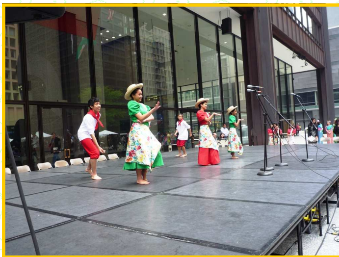
Trên 45 ca đoàn và vũ đoàn đến tham dự để giới thiệu âm nhạc, nghệ thuật, và văn hóa Á châu đến các cộng đồng người Mỹ tại Chicago