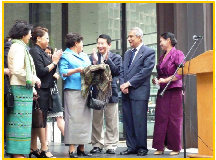
Trên 45 ca đoàn và vũ đoàn đến tham dự để giới thiệu âm nhạc, nghệ thuật, và văn hóa Á châu đến các cộng đồng người Mỹ tại Chicago