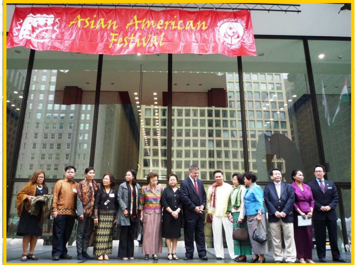
Nghĩa Sinh hợp tác tổ chức Lễ Hội Văn Hóa Á Kiều tại Chicago năm Thứ 12 Từ ngày 17 đến 21 tháng 5 năm 2010 với gần 18 ngàn người tham dự