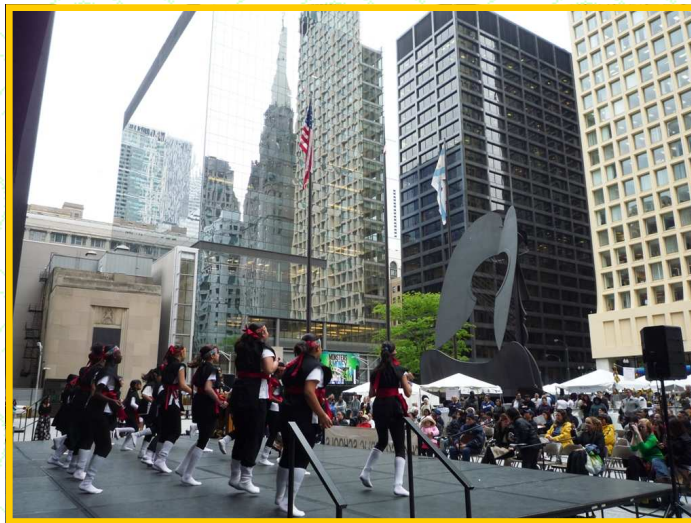
Trên 45 ca đoàn và vũ đoàn đến tham dự để giới thiệu âm nhạc, nghệ thuật, và văn hóa Á châu đến các cộng đồng người Mỹ tại Chicago