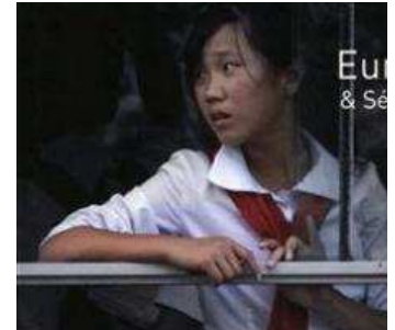
Hội ký của một thiếu nữ Bắc 1 năm để thoát khỏi địa ngục