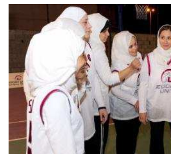
Lần đầu tiên có nữ vận động viên Thế vận hội