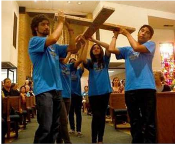
tham dự thánh lễ cầu nguyện cho thành viên trẻ Việt tham dự ĐHGTTG (hình dưới).