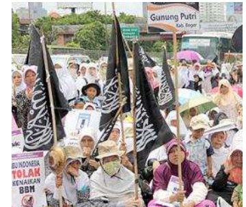
Phụ nữ Indonesia biểu tình ch