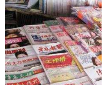
Những thủ thuật kiểm duyệt b Quốc