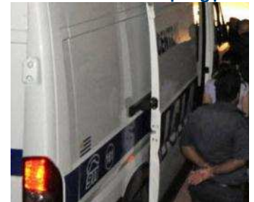
Y tá Uruguay thừa nhận “giết đạo” hàng loạt