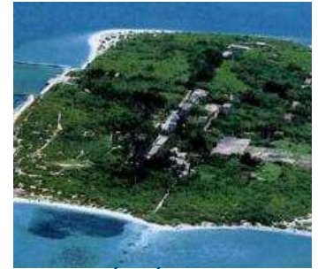
Trung Quốc bắt ngư dân Việt và Bắc Kinh khấu chiến