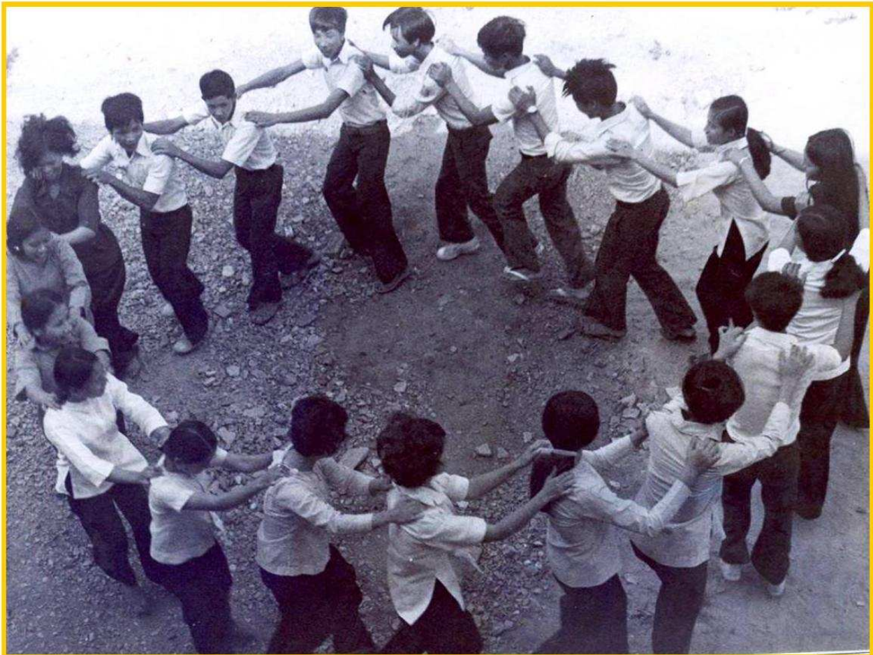
Những ngày sinh hoạt ở trại, các em tạm thời quên đi những nhọc nhằn trong lớp, cùng nhau vui