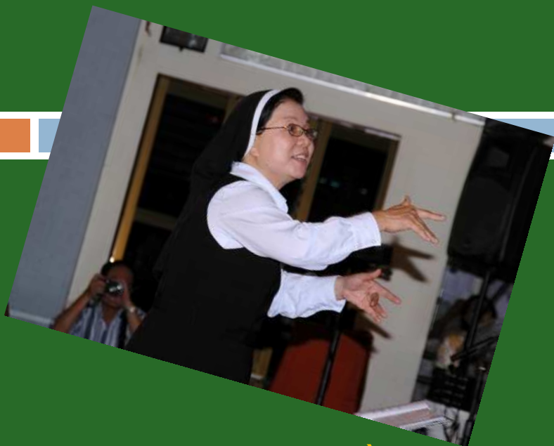
Nt Thiên Lan với bài RA ĐỜI